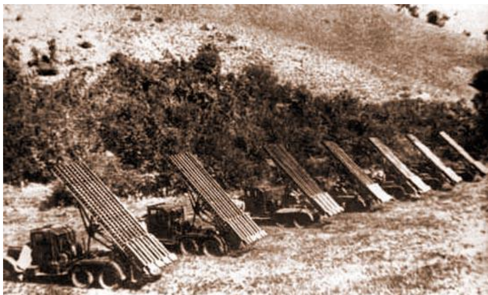
Примерно так выглядела Первая экспериментальная батарея М-13-16 на позиции под Оршей

Вторая дорога в Оршу идёт с севера. Это шоссе Орша – Витебск от пересечения её с магистралью Москва – Минск возле посёлка Обухово. Здесь на месте взорванного моста через Оршицу немцы наводили переправу, по которой дала залп батарея Флёрова.