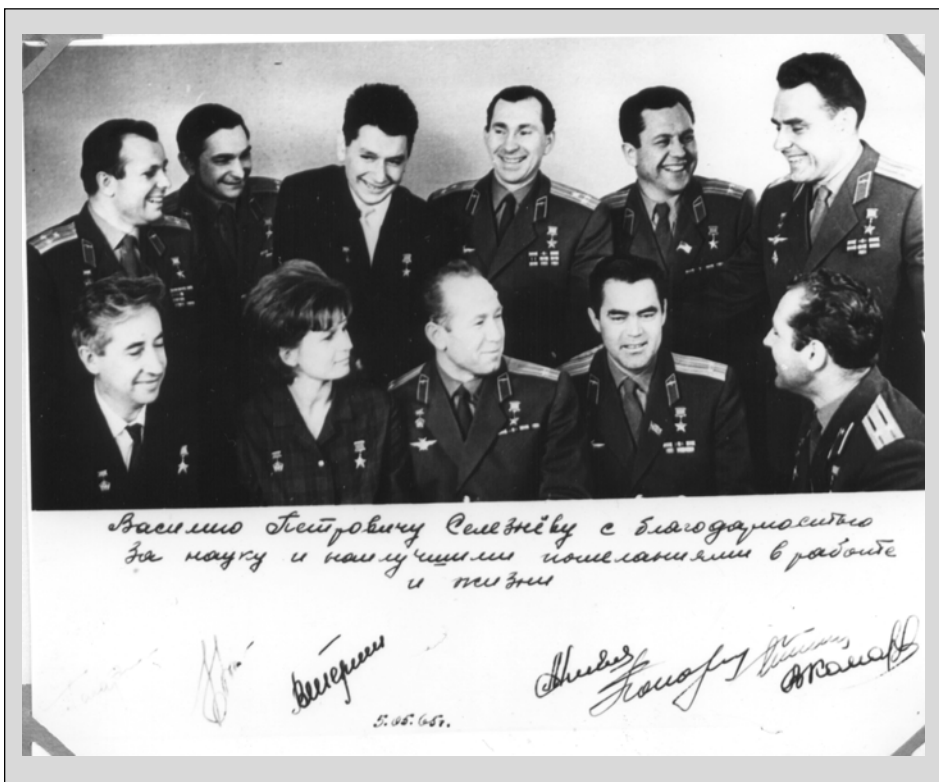
Эту фотографию первые космонавты подарили В.П.Селёзеву