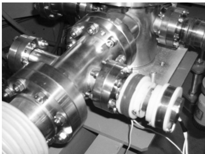
Экспериментальная установка. Белые кольца в правой нижней части — изоляция катушек L1, L2, которые управляют кареткой с пластинкой, перекрывающей путь излучения

только как ученого-физика, но и философа и политика. В свете этих данных становятся объяснимы действия нью-йоркской еврейской общины. Для привлечения к себе паствы в современных условиях необходимы свои современные боги. Вот и возводится в ранг святого мистик и сионист А.Эйнштейн». Завершает Жданов предисловие предупреждением: «До выхода в свет брошюры взгляды на теорию относительности можно рассматривать как заблуждение. Сейчас же продолжение преподавания теории относительности, особенно в школе, является умышленным обманом. А это — не смешно».