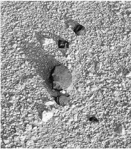
1 Фрагменты метеоритов в каменистой пустыне Омана

идея, что источником SNC-метеоритов должно быть крупное планетное тело, сопоставимое по размерам с Землей, то есть способное удерживать летучие элементы и оставаться геологически активным длительное время после образования.