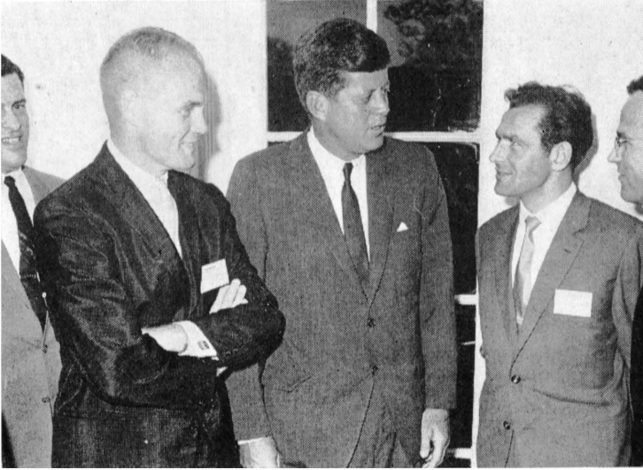
▲ Der sowjetische Kosmonaut German Titow wurde am 3. Mai gemeinsam mit seinem amerikanischen Kollegen John Glenn von USA-Präsident Kennedy empfangen, dem sie über ihre Erlebnisse beim Weltraumflug berichteten. Unser Bild zeigt Kennedy im Gespräch mit Titow (rechts) und Glenn.