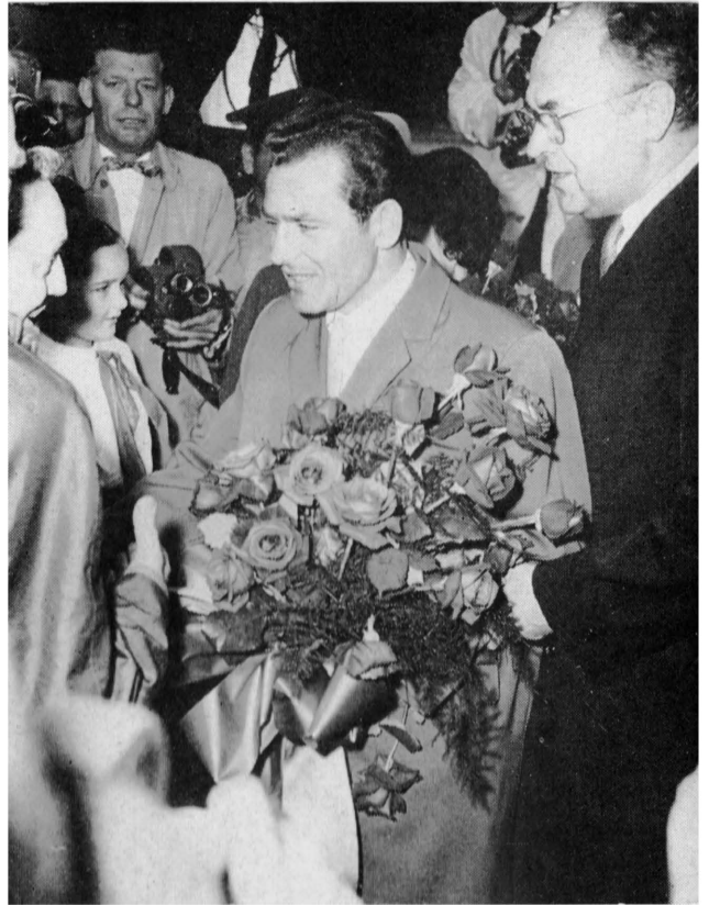
▲ Titow traf auf seiner Amerika-Reise am 2. Mai in Washington ein, wo er und seine Gattin auf dem Flughafen begrüßt wurden. Junge Mädchen empfingen den berühmten Weltraumfahrer mit Blumen.