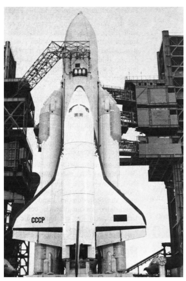
Die mächtige Trägerrakete Energija und die wiederverwendbare Raumfähre Buran auf dem "Weltraumbahnhof" Baikonur in Kasachstan

Die Bedingungen für ein Experiment im Weltraum, ganz besonders im fernen