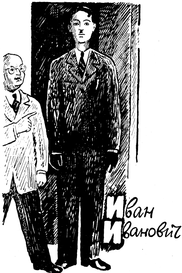
Рисунки В. ВАКИДИНА

В се дело в обстановке и настроении: иногда простая, в сущности, вещь выглядит так, словно мир встал дыбом и квадрат гипотенузы равен постоянной Планка.