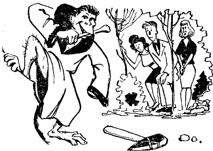
Рисунки Г. КОВАНОВА