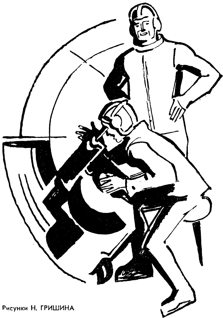
Рисунки Н. ГРИШИНА

стрела и колос — космическая эмблема Земли. К сожалению, Вен был один — Горт был занят в кинжальном отсеке.