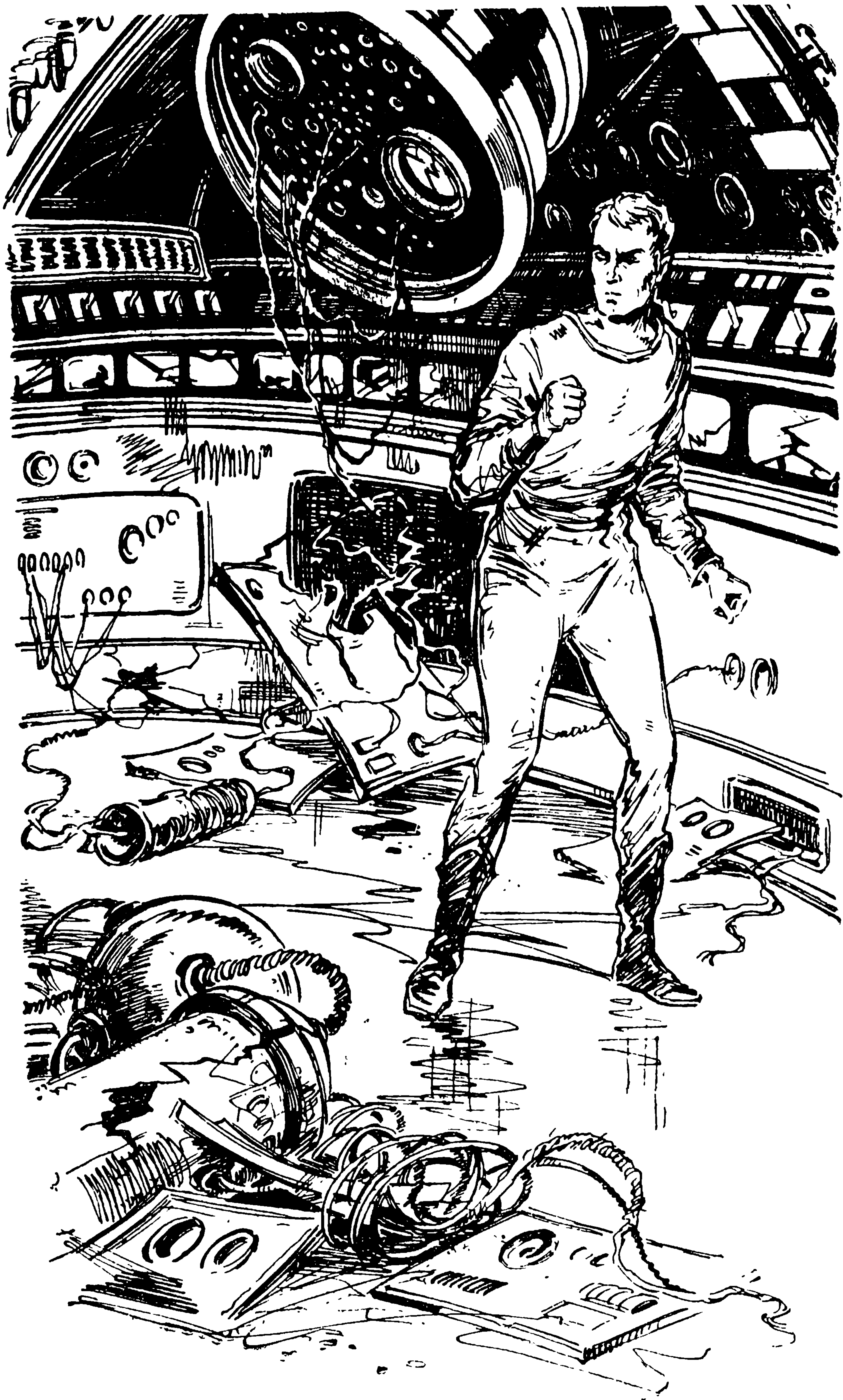
Рисунки Ю. МАКАРОВА