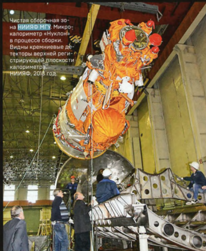
Чистая сборочная зона НИИЯФ МГУ. Микрокалориметр «Нуклон» в процессе сборки. Видны кремниевые детекторы верхней регистрирующей плоскости калориметра. НИИЯФ, 2016 год.

Подробнее здесь: «КШ» № 1-2 (15-16) за январь – февраль 2016 года.