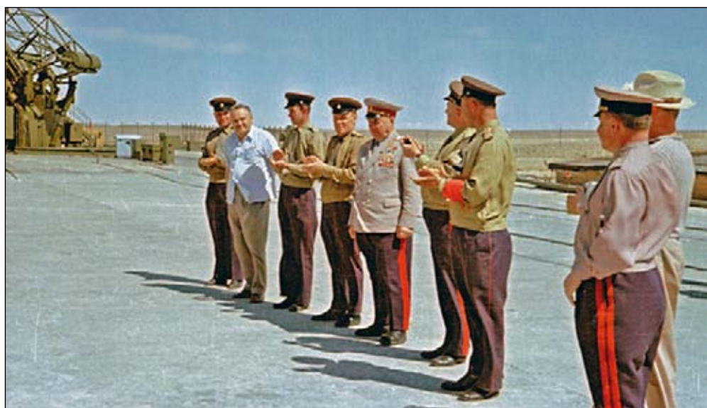
Сергей Королёв приветствует стартовую команду корабля «Восток-3». Байконур. 1962 год.

Корабли-спутники «Восток», которыми в то время располагала советская ракетно-космическая отрасль, не могли маневрировать. Единственное, на что они были способны, — лететь по заданной траектории с первой космической скоростью и в нужный момент включить тормозную двигательную установку (ТДУ), чтобы, снизив скорость, сойти с орбиты и приземлиться в расчётном месте. Но даже с этим возникли проблемы. Из-за сбоя в работе