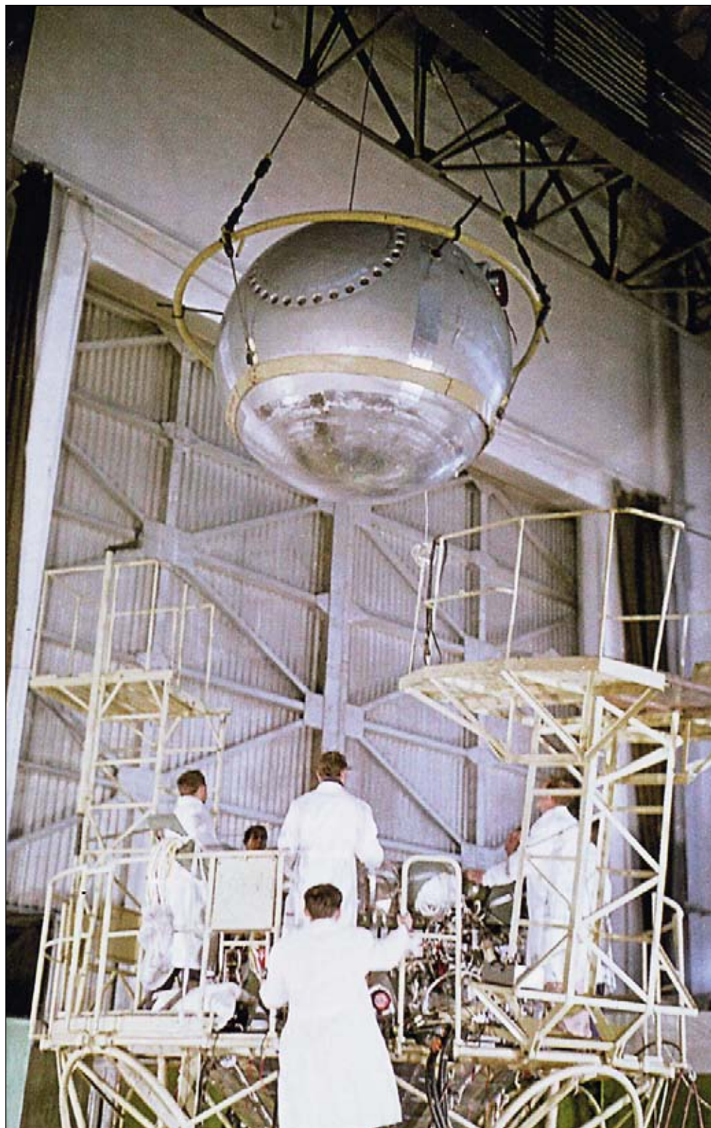
Спускаемый аппарат корабля «Восток» в сборочном цехе.