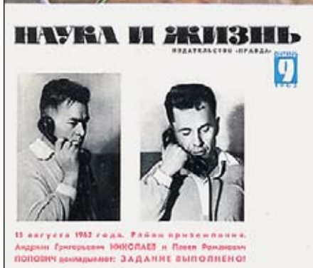
Обложка журнала «Наука и жизнь», посвящённого итогам первого группового полёта.