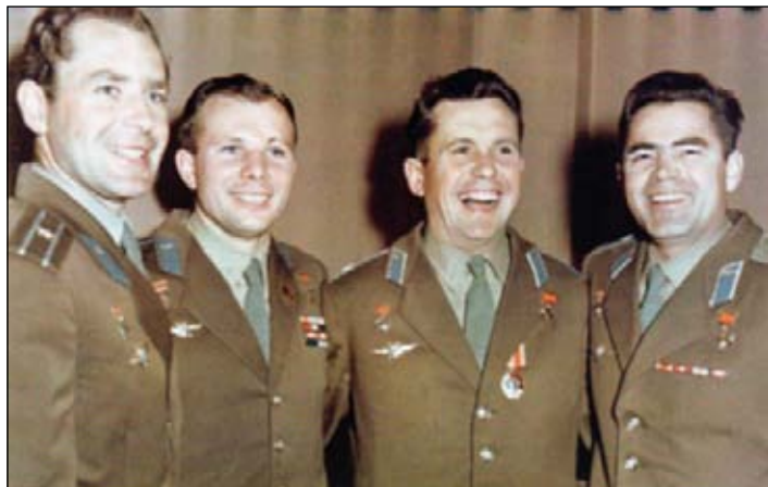
Первая четвёрка космонавтов (слева направо): Герман Титов, Юрий Гагарин, Павел Попович, Андриян Николаев.

и сведения о планетах, Солнце, звёздах и туманностях безбрежного космического пространства...»