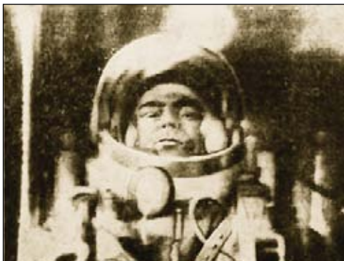
Павел Попович и Андриян Николаев на орбите (кадры из телетрансляции).