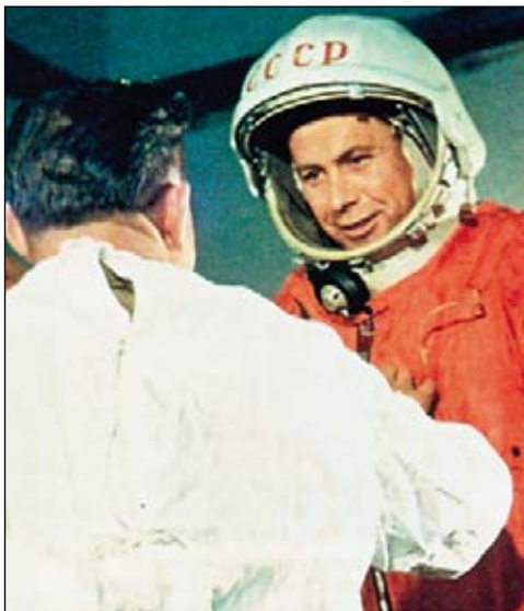
Павел Попович примеряет скафандр.

К февралю «фирма» Сергея Королёва подготовила уже два пилотируемых корабля, о чём главный конструктор немедленно доложил руководству. Глава государства Никита Сергеевич Хрущёв с энтузиазмом поддержал его и распорядился провести групповой полёт двух кораблей, который, по его мнению, докажет всему миру безнадёжное отставание американцев в космонавтике. И действительно — в феврале 1962 года американцы сумели организовать лишь один орбитальный полёт, продолжавшийся три витка: его совершил Джон Гленн на корабле «Mercury» («Friendship 7»).