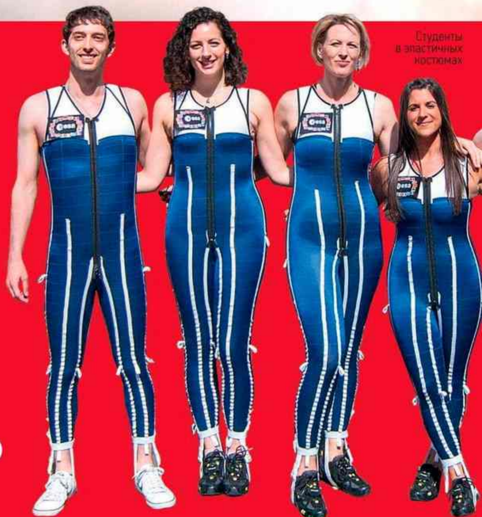
Студенты в эластичных костюмах