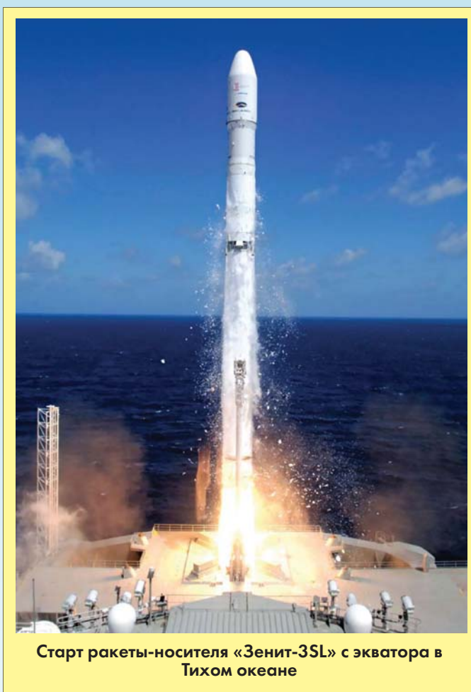
Старт ракеты-носителя «Зенит-3SL» с экватора в Тихом океане

Это, по экспертным оценкам, наиболее удачная конверсионная разработка постсоветской космонавтики — российско-украинский проект, разрабатываемый с 1992 года. Она создана на базе знаменитой РС-20 (SS-18 «Сатана»), боевой ресурс которой не исчерпан и до сих пор пугает даже американцев (спасая нас от участи сербов или иракцев). По договору СНВ-1, половина всех этих ракет должна была быть уничтожена. Но в 90-х власти Украины и России приняли удачное решение, и 150 ракет вместо ликвидации стали заготовками для превращения в ракету-носитель. Как и SS-18 «Сатана», она обладает высокими энергетическими возможностями и надежностью. Ракета имеет стартовую массу 211 т, длину 34 м, диаметр 3 м и способна вывести на орбиту высотой 300-900 км космический аппарат или группу спутников различного назначения стартовой массой до 3,7 т. Один запуск «Днепра» стоит около €18 млн. Ракета стартует из шахтной пуско-