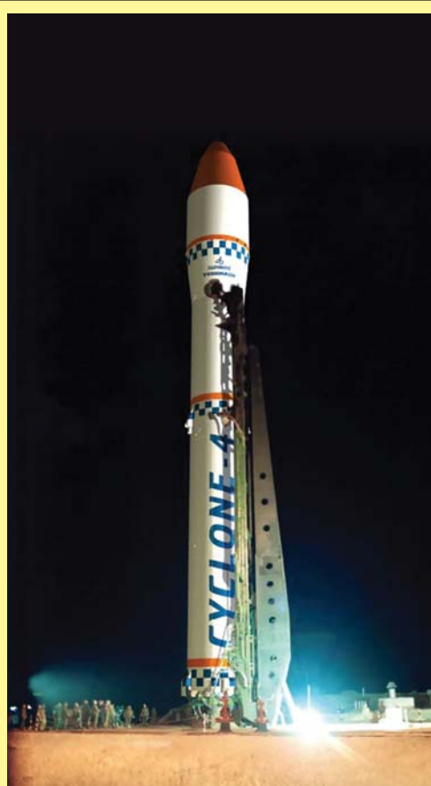
Будущий комплекс «Циклон-4» на космодроме Алкантара в Бразилии

Новое ОКБ (от Минавиапрома) было создано в ХАИ сразу после войны, в 1946 г. По данным «Независимого военного обозрения», оно находилось в постоянной конкуренции с Днепропетровской реактивной группой, занимавшейся аналогичными задачами, и через 2 года было ликвидировано «... в связи с необходимостью сосредоточить работающих в области создания реактивных двигателей в более крупных организациях». Но в 1951 г. за дело в Харькове принялись по-серьезному — новому заводу «Электроинструмент» (затем «Коммунар», или №897) поручалось поставлять Днепропетровскому заводу № 586 бортовую аппаратуру системы управления (СУ) для производимых этим предприятием ракет Р-1, Р-2, Р-5. Аппаратура выпускалась по документации московского НИИ-885. В составе завода было образовано СКБ во главе с директором завода. В 1959 году на