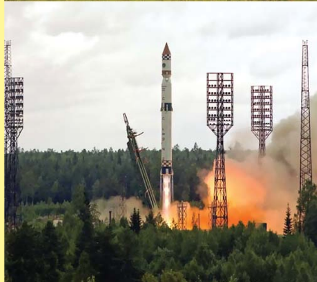
31.07.2001 Ракета-носитель «Циклон-3» вывела на орбиту КА «АУОС-СМ-КФ», предназначенный для исследования Солнца

запуск спутников западных или крупных некосмических стран. Услугами «Зенита» пользуются владельцы спутников США (спутники Telstar, Rock и др.), Израиля (AMOS), Малайзии (Messat), Египта, Саударавии и др. Уже к 2001 было сделано 5 запусков, в дальнейшем происходило по несколько запусков ежегодно. Со временем программа морских стартов была дополнена программой запусков с космодромов — «Наземный старт». К 2008 г. местом для нее стал казахстанский Байконур, а первыми спутниками наземного запуска — израильские AMOSы.