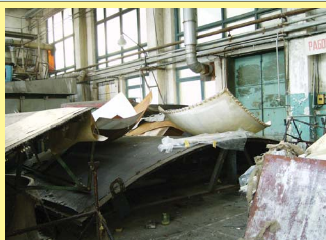
В цехах застыла перестройка...