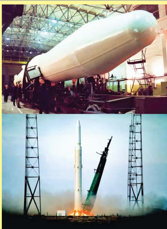
РН «Циклон-2» на космодроме Байконур

Соответственно, данные РН ориентированы в основном на