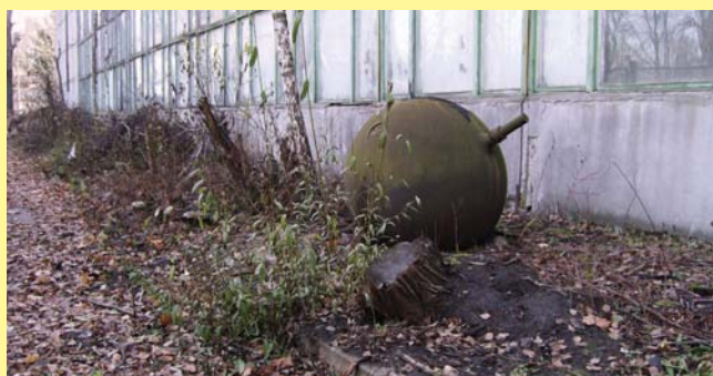
Типичный ландшафт у стен НПО «Сатурн», «Квант» и др., территория любого НИИ и НПО — до сих пор «музей под небом»...

На протяжении более 50 лет главным партнером КБ «Южное» является производственное объединение «Южный машиностроительный завод». Работа этого тандема до сих пор дает возможность быстро и качественно осуществлять полный комплекс работ, от первичной конструкторской разработки до выпуска серийной продукции. По данным пресс-службы КБ и НКАУ, за период деятельности системы КБ «Южное»/ПО «Южмаш» создано 13 боевых ракетных комплексов, 7 космических ракетных комплексов, более 70 типов космических аппаратов, около 50 типов ракетных двигателей и двигательных установок различного назначения, свыше 150 новых материалов и технологий. Результатом совместной работы стало осуществление более 900 пусков ракет-носителей космического назначения, вывод на орбиты более 400 спутников в интересах астрофизических наблюдений, глобальных исследований, дистанционного зондирования Земли и Мирового океана, а также задач национальной обороны. КБ «Южное» — единственная компания в мире, которой принадлежат три семейства (пять типов) ракет-носителей, находящиеся в эксплуатации: «Циклон-2», «Циклон-3», «Днепр», «Зенит-2» и «Зенит-3SL».