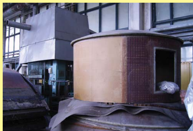
...но что-то и делается, и очень неплохого качества