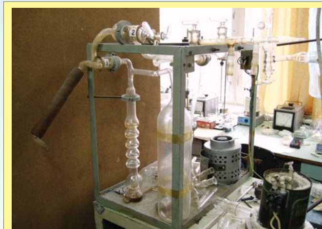
Оборудование для порошковых компонентов не всегда современно, а иногда напоминает времена 1-й мировой

О том, как работают остальные предприятия, задействованные в космическо-ракетной отрасли сегодня, можно сделать репортаж под названием «инновации за счет энтузиазма» (это