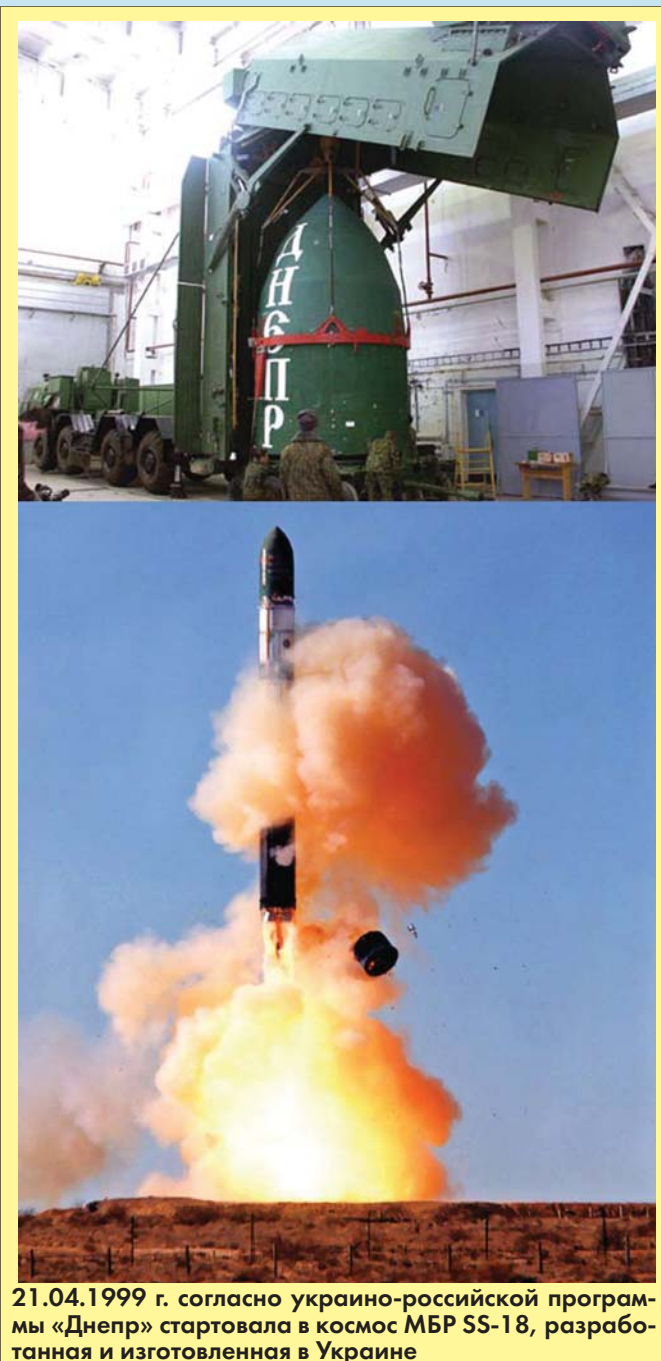
21.04.1999 г. согласно украинско-российской программы «Днепр» стартовала в космос МБР SS-18, разработанная и изготовленная в Украине

В СНГ Украина начала взаимодействие с Беларусью, решившей до 2012 г. создать свое космическое агентство. Подписанный в Минске главой НКАУ и председателем президиума Национальной академии наук Белоруссии документ предус-