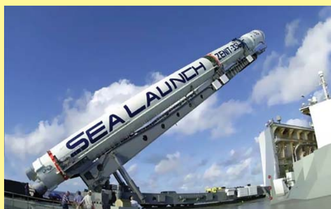
Установка ракеты-носителя Зенит-3SL на стартовую платформу «Одиссей»

матривает совместное выполнение научных космических исследований и прикладных программ, совместное создание микроспутников дистанционного зондирования Земли и полезной нагрузки для них (оптико-электронной и спектральной аппаратуры), систем управления, разработку современных технологий обработки данных. Среди совместных проектов, в частности, — использование информации от украинского и белорусского спутников «Сич-2» и «БелКА-2» после их запусков на околоземную орбиту.