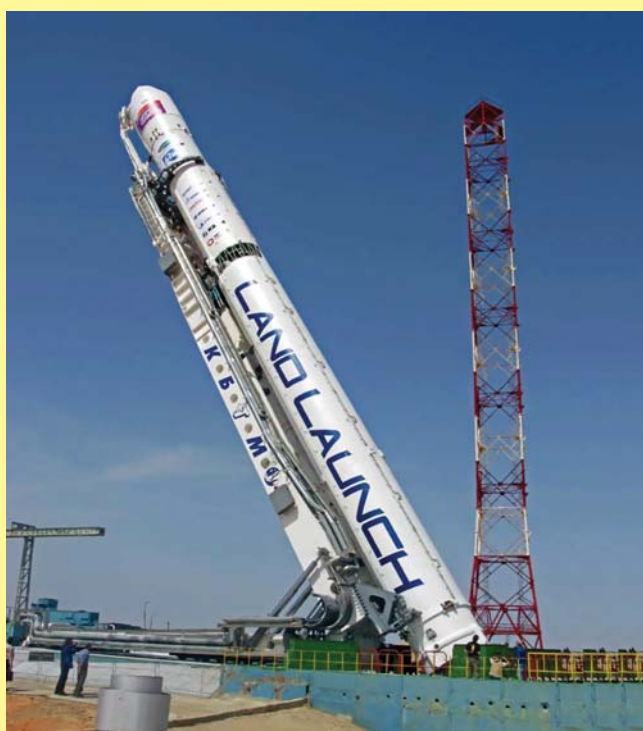
Ракета-носитель «Зенит-3SLB». Подготовка к пуску со стартовой площадки космодрома Байконур

гласно КОСМОТРАС, ни одна другая компания-оператор запуска в мире не может предложить заказчику такой вид сервиса.