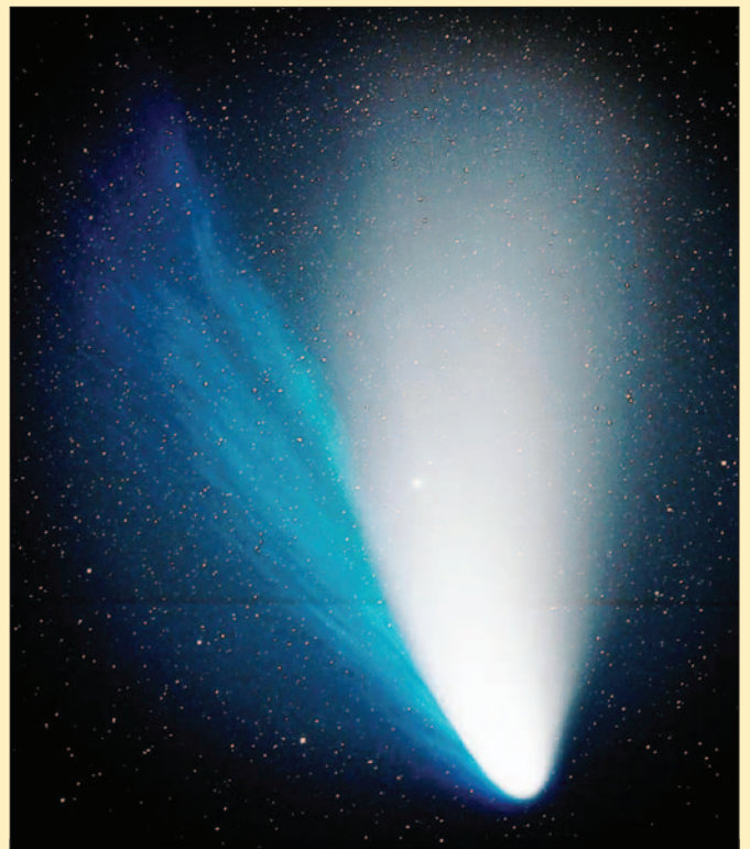
Комета Хейла — Боппа

30 июня 1908 г. в бассейне Подкаменной Тунгуски (Сибирь) произошло редкое событие, которое позже назвали