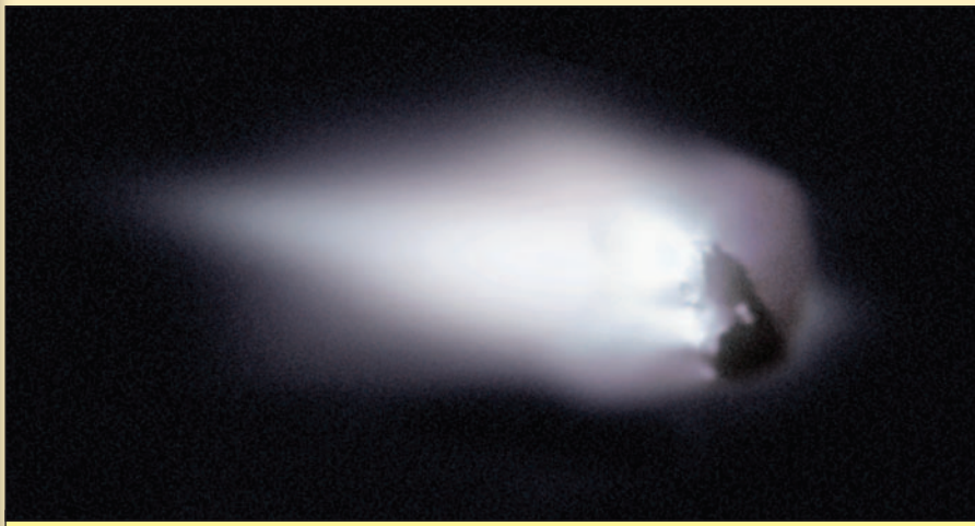
Ядро кометы Галлея, сфотографированное европейским космическим аппаратом Джотто в 1986 году

Тунгусским метеоритом, а точнее — Тунгусским феноменом. Оно сопровождалось оптическим, акустическим, сейсмическим, геомагнитным и биологическим эффектами. На высоте 6...8 км произошел взрыв, на большой площади был повален и частично сожжен лес. Вспышка света и звук фиксировались на расстоянии 750 км, приборы в г. Потсдаме (Германия) зарегистрировали акустические волны, которые прошли расстояния 5 тыс. км (прямая волна) и 35 тыс. км (обратная волна). Ночное небо в Сибири и Европе было настолько светлым, что можно было читать книгу. Прозрачность атмосферы над США в июле — августе заметно снизилась. В Иркутске (расстояние — 900 км) наблю-