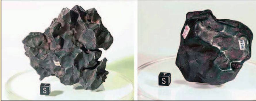
Фрагменты обломков Сихотэ-Алинского метеорита

гому пути. Как говорят физики, а за ними и философы, историческая линия испытала бы бифуркацию, т. е. раздвоение, приводящее к качественным изменениям.