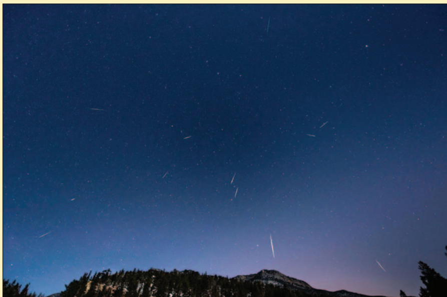
Метеорный поток, зафиксированный в штате Колорадо, США, в январе 2013 г.

рость — 11...73 км/с. По химическому составу метеориты делят на такие четыре класса: