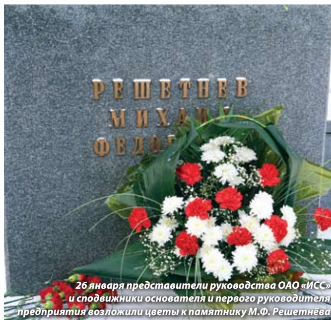
26 января представители руководства ОАО «ИСС» и сподвижники основателя и первого руководителя предприятия возложили цветы к памятнику М.Ф. Решетнёва

При этом Решетнёв активно занимался научной деятельностью. Михаил Фёдорович – автор более двухсот научных трудов. Тридцать пять его изобретений