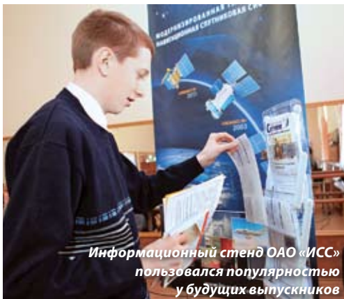
Информационный стенд ОАО «ИСС» пользовался популярностью у будущих выпускников

Предприятие заинтересовано в том, чтобы коллектив пополнялся выпускниками ведущих вузов страны, имеющими хороший уровень знаний и представление о специфике деятельности спутникостроительной фирмы. На сегодняшний день ИСС сотрудничает с 14-ю университетами в Красноярске, Томске, Новосибирске, Москве, Санкт-Петербурге, Казани, Самаре, а также учреждениями среднеспециального образования Железногорска, Сосновоборска и Красноярска. По приглашению предприятия их представители приняли участие в ярмарке вакансий, где рассказали об образовательных программах и ответили на вопросы потенциальных абитуриентов.