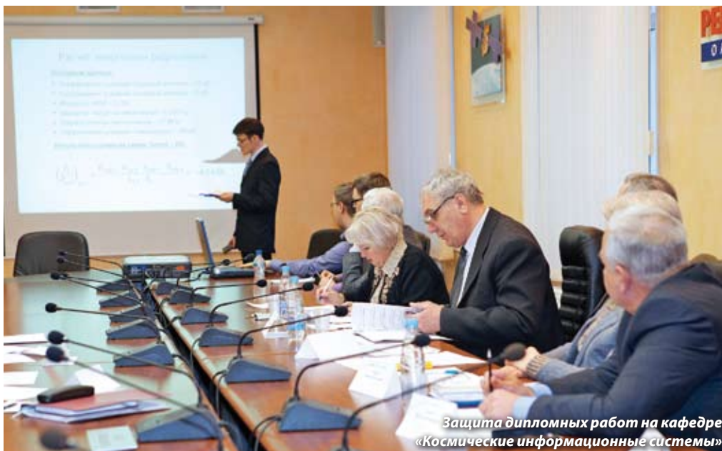
Защита дипломных работ на кафедре «Космические информационные системы»

Привлечение молодых высококвалифицированных специалистов – одно из приоритетных направлений кадровой политики ОАО «ИСС». Ежегодно на предприятии готовят и защищают дипломные проекты выпускники ведущих технических вузов страны. 20 января выпускные квалификационные работы представили студенты Сибирского государственного аэрокосмического университета имени академика М.Ф. Решетнёва.