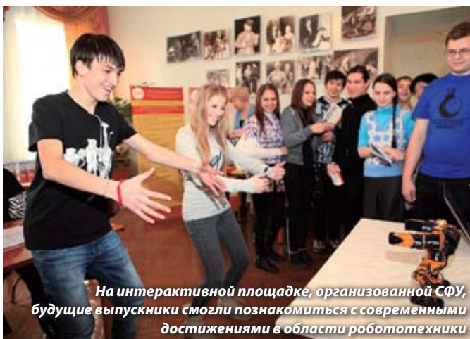
На интерактивной площадке, организованной СФУ, будущие выпускники смогли познакомиться с современными достижениями в области робототехники

Побывав на ярмарке, старшеклассники получили представление о преимуществах тех или иных образовательных учреждений, востребованных специальностях и перспективах развития фирмы Решетнёва. О результативности этого мероприятия можно будет говорить весной, когда станет известно точное количество выпускников, записавшихся на целевой набор.