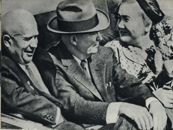
Н. С. Хрущев, Д. Эйзенхауэр и Н. П. Хрущева на пути с аэродрома Эндрос в Вашингтон.