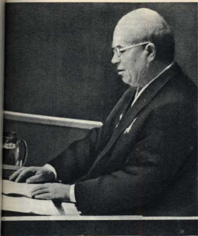
Товарищ Н. С. Хрущев выступает с речью на заседании 14-й сессии Генеральной Ассамблеи Организации Объединенных Наций.

Советская программа разоружения, теплый прием, оказанный Никите Сергеевичу Хрущеву американским народом, асяют в человеческие сердца уверенность в том, что будет покончено наконец с «холодной войной». Стрелка барометра международных отношений прочно остановится на «ясно». Сбудутся мечты и надежды человечества об окончательной победе великого дела мира, которое так терпеливо и настойчиво отстаивают советский народ и Советское правительство!