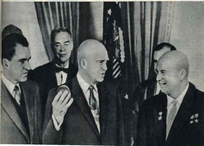
15 сентября Председатель Совета Министров СССР Н. С. Хрущев вручил Президенту США Д. Эйзенхауэру копию вымпела, оставленного на Луну в советской космической ракете. На снимке: Н. С. Хрущев и Д. Эйзенхауэр во время вручения памятного дара.