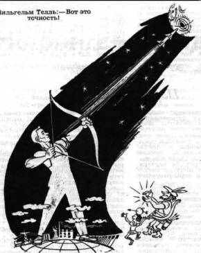
Рисунок Ю. Черепанова.