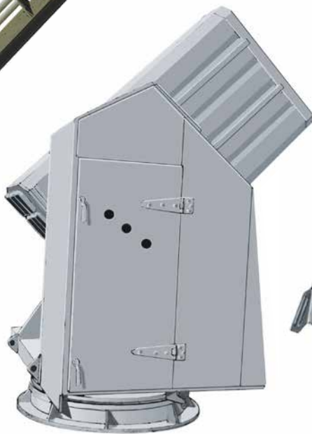
Пусковая установка управляемых зенитных ракет британского линейного крейсера «Худ»