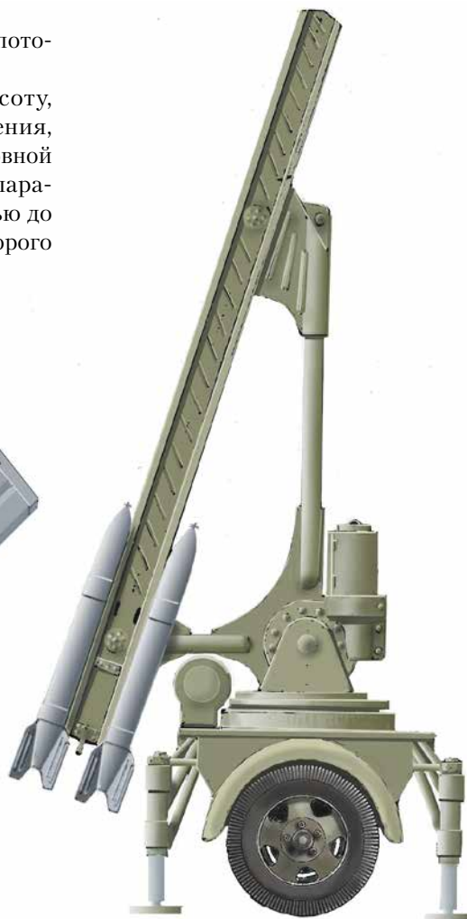
Советская пусковая установка для управляемых зенитных ракет РС-132