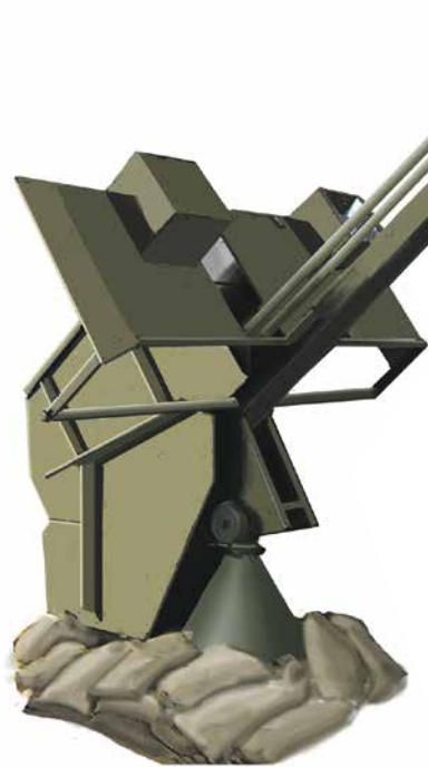
Британская одноствольная пусковая установка Z Battery для управляемых зенитных ракет

Летом 1940 г. для системы ПВО была создана ракета UR-3. Её калибр 76,2 мм. В носовой части расположен конический обтекатель, стабилизатор четырёхпёрый. Ракета, как и UR,