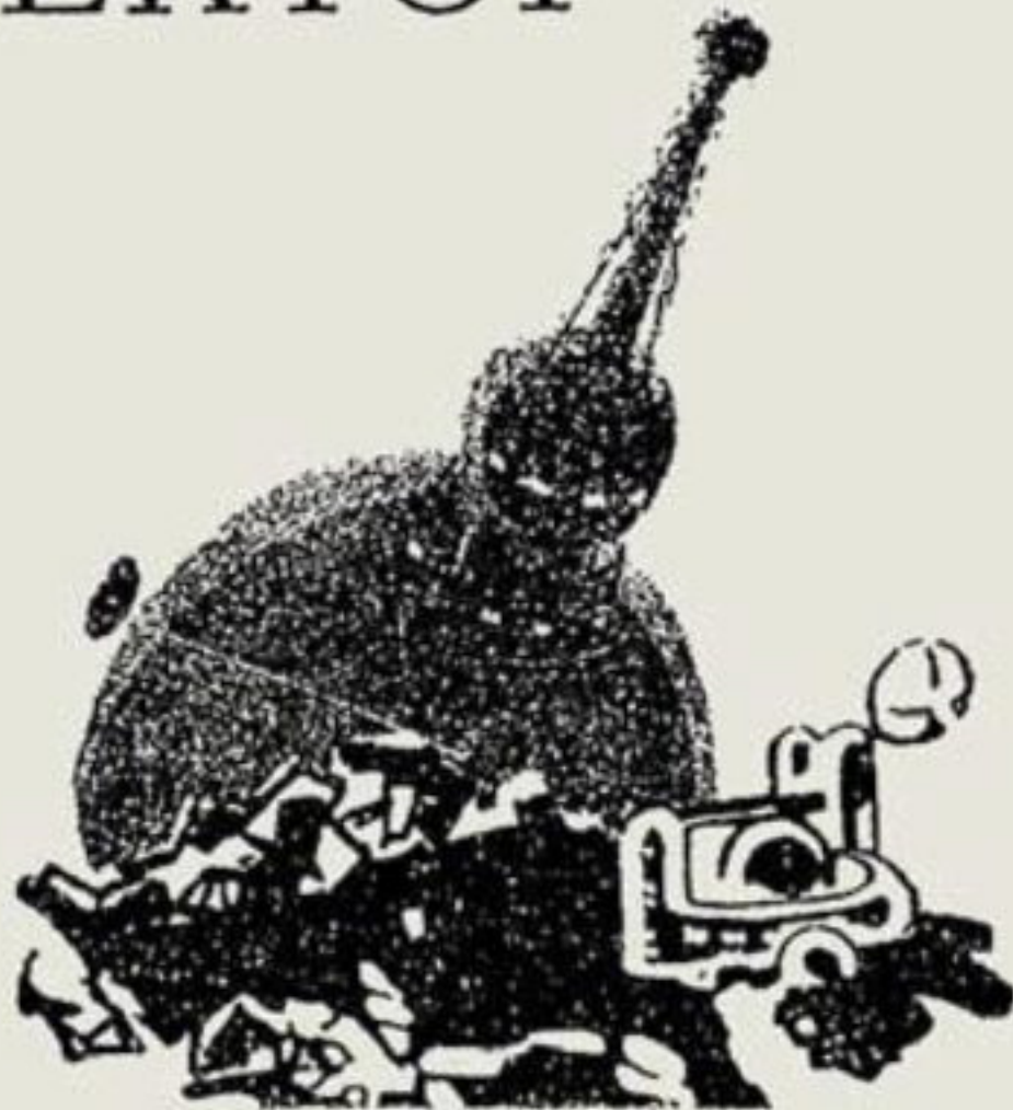
Рисунки Н. Гришина

В конце двадцатого века с одного из космодромов Советского Союза стартовал первый в мире фотонный планетолет «Хиус». Экипажу «Хиуса» предстояло решить трудную задачу: разведать подступы к Урановой Голконде, мощному месторождению радиоактивных ископаемых на Венере.