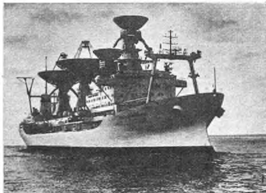
В управлении межпланетными автоматическими станциями принимают участие наряду со станциями наземного командно-измерительного комплекса экспедиционные научно-исследовательские суда Академии наук СССР.