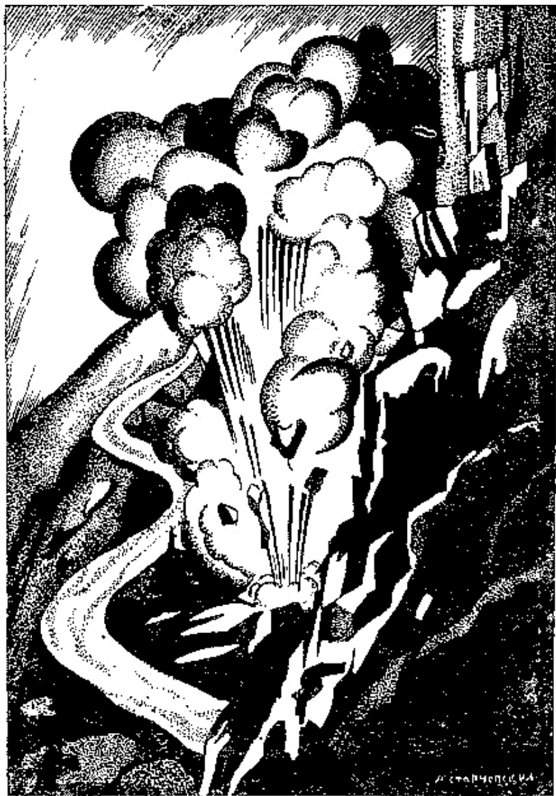
Ракета взорвалась, и скала над озером засияла, как солнце.