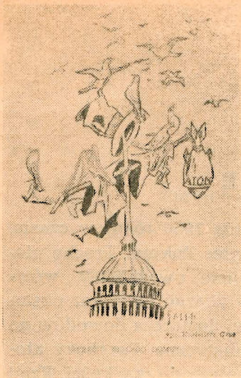
Strach „Białego Domu“. Rys. Kazimierza Grusa