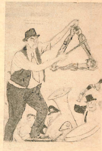
Nowy instrument orkiestry podżegaczy. J. F. Dulles żąda stworzenia w Europie „żelaznego trójkąta“, składającego się z Zachodnich Niemiec, Hiszpanii i Turcji

Generałowie i inni wojskowi specjaliści z Pentagonu — amerykańskiego ministerstwa wojny, są jednakże tylko narzędziem w rękę wielkich finansistów, którzy sprawują rzeczywistą władzę nad krajem. O tych wielkich rekinach przemysłowych napisano już i powiedziano wiele rzeczy trafnych i nie chcemy powtarzać ich na tym miejscu; pragnęliśmy zwrócić uwagę na jedną tylko charakterystyczną stronę ich psychologii, którą chcieliśmy ukazać w postaci milionera, Morrisa.