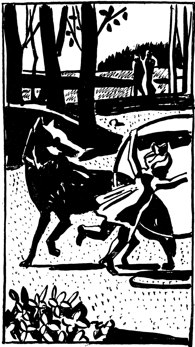
Рисунки В. КОЛТУНОВА