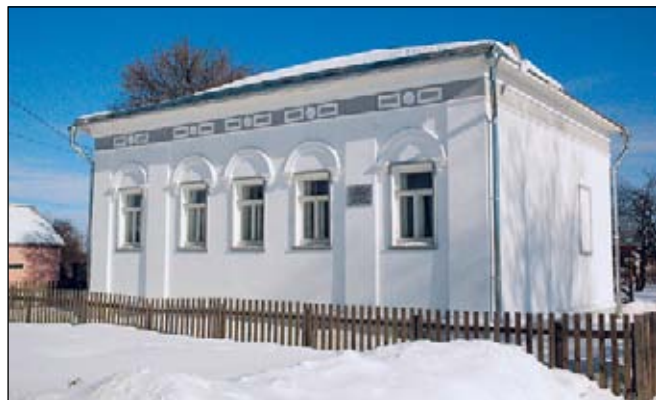
Дом, в котором родился К. Э. Циолковский. Сейчас здесь разместили филиал Ижевского музея космонавтики.