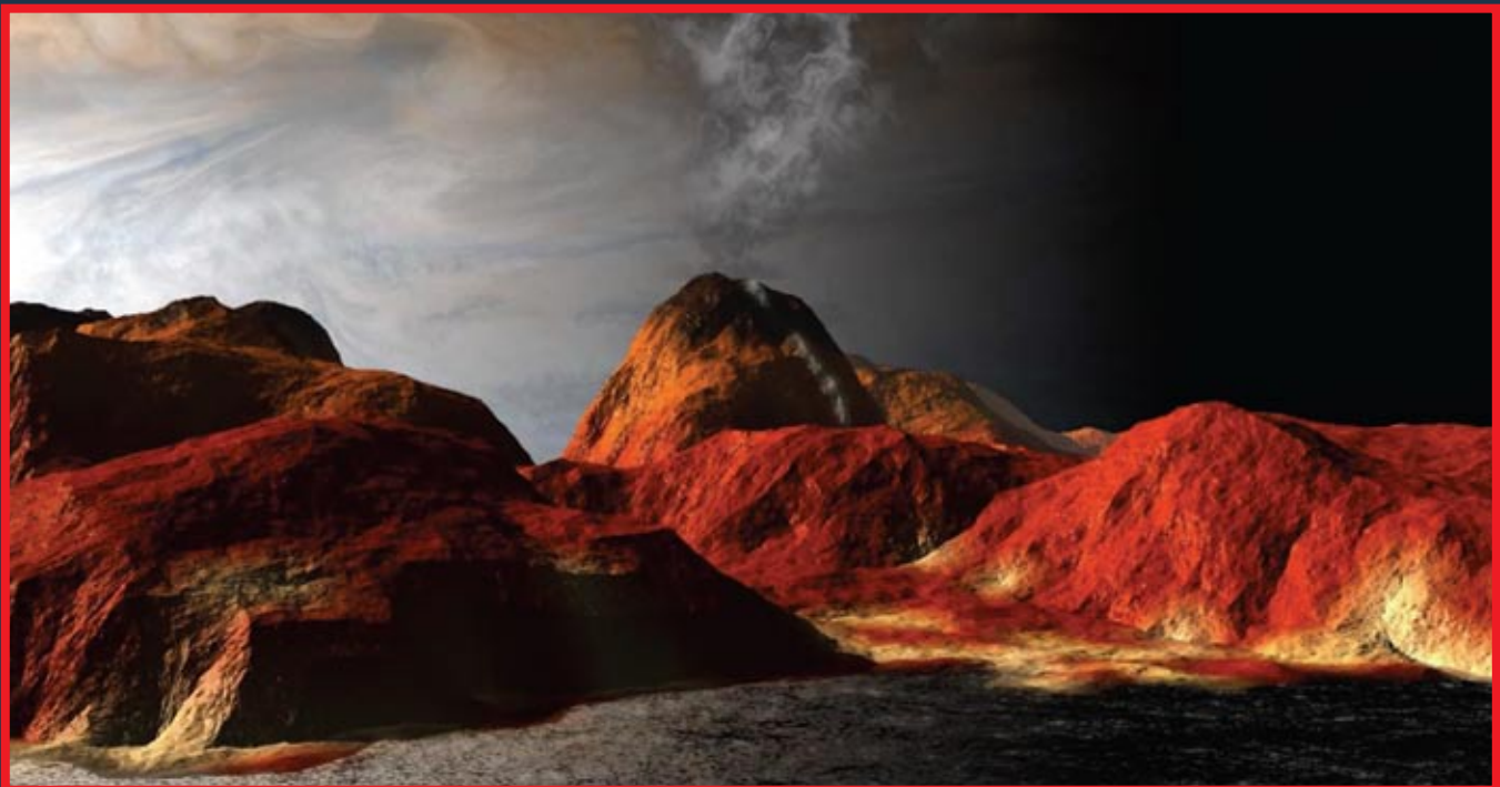
Спутник Юпитера Ио в исполнении художника

Сторонники катастрофического происхождения околоземного диска предполагают, что этот диск образовался при столкно-