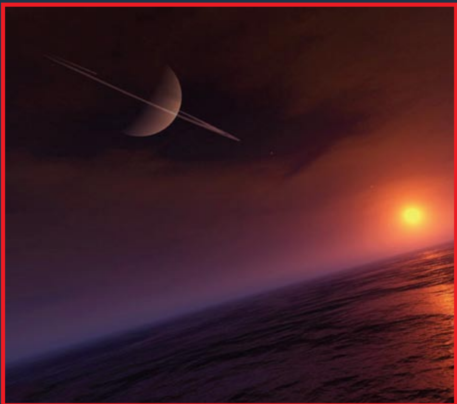
Вид на Юпитер с поверхности Ио в исполнении художника

Систему спутников Юпитера часто сравнивают с миниатюрной Солнечной системой. Регулярный характер орбит галилеевых спутников и четырех малых спутников, обращающихся