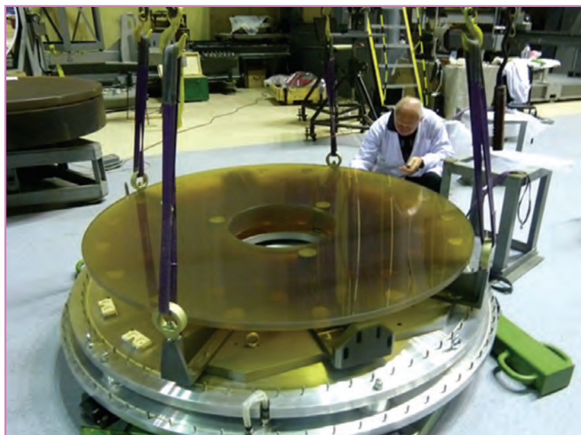
Главное зеркало телескопа T-170M

назначен для наблюдений слабых объектов (например, далеких галактик) с умеренной дисперсией.