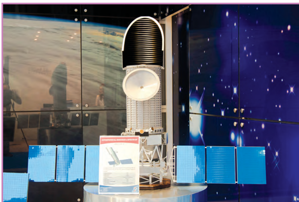
«Спектр-УФ» («Всемирная космическая обсерватория — Ультрафиолет»)

Проблема, однако, не исчерпывается лишь созданием приборов, чувствительных к излучению нужной частоты. К получению объективной картины из космоса есть и другие препятствия. Например, мы привыкли считать, что земная атмосфера прозрачна. Но это не так.