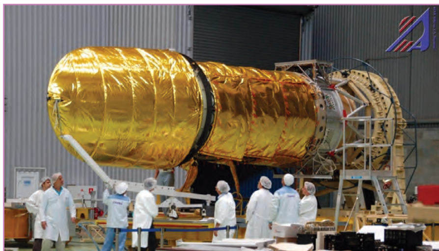
Испытания телескопа Т-170М в НПО им. Лавочкина

Основным инструментом обсерватории станет космический телескоп Т-170М с главным зеркалом диаметром 170 см, разработанный НПО им. Лавочкина при участии Государственного космического агентства Украины.