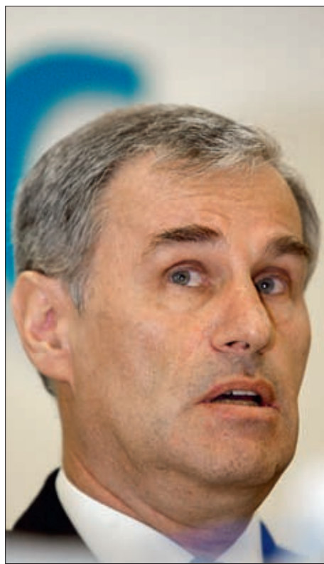
Под руководством Юрия Соломонова создавались наши знаменитые МБР «Тополь» и «Тополь-М»

Надо сказать, что еще на стадии начала проектирования некоторые заявленные характеристики новой ракеты выглядели сом-