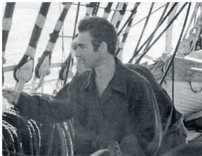
В море дистанция от ученого до матроса невелика

обитаемых аппаратах, начиная еще со старого «Байсиса» и кончая современными аппаратами «Мир», на которых мне посчастливилось опускаться на достаточно большие глубины — в четыре с половиной километра в Северной Атлантике. Я изучал геологию океанского дна, вместе с другими учеными участвовал в создании новой теории литосферных плит, которая совершила революцию в науках о Земле. Защитил докторскую диссертацию