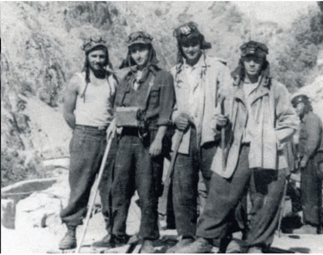
Перед экспедицией геологи получали цигейковую куртку, спальный мешок и карабин