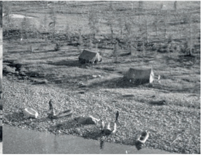
Первой экзотикой, с которой сталкивались «поисковики», были бесконечные зоны