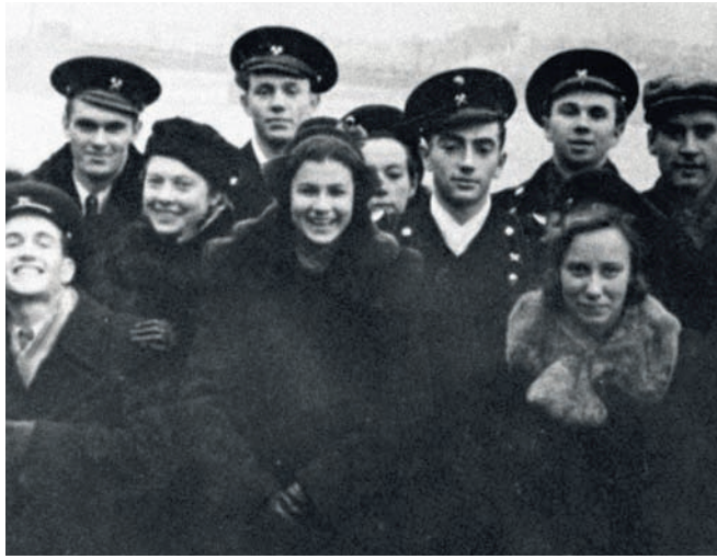
Выпускники Горного института отправлялись искать полезные ископаемые, как правило, — далеко на север

МОРЕ НАВСЕГДА Для каждого моряка его первое в жизни судно незабываемо, как первая любовь. Вот для меня таким судном стало судно «Крузенштерн», огромный парусник, один из самых больших в мире, на трап которого я поднялся 45 лет назад в заметном декабрьской вьюгой Балтийске. С этого момента начались мои океанские плавания. Мне довелось плавать во всех океанах, даже купаться во всех океанах, в том числе