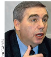
АЛЕКСАНДР КОНОНОВ, президент Института стратегических оценок

Сегодня космос широко используется военными: для наблюдения за объектами, для вычисления траектории при запуске ракет, системы связи работают через него, там действуют разведывательные спутники. Когда же речь заходит именно о размещении оружия в космосе, то в настоящее время это остается на уровне