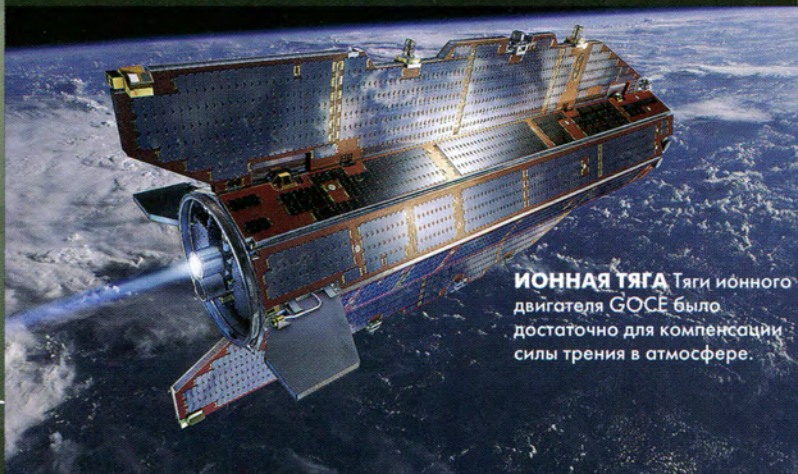
ИОННАЯ ТЯГА Тяги ионного двигателя GOCE было достаточно для компенсации силы трения в атмосфере.

GOCE находился на очень низкой высоте (280 км над Землей), так что атмосферное трение и солнечная активность оказывали большое влияние на его траекторию.