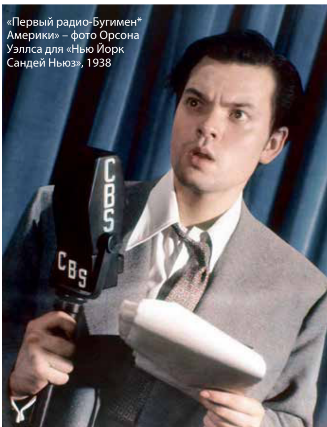
«Первый радио-Бугимен* Америки» – фото Орсона Уэллса для «Нью Йорк Сандей Ньюз», 1938

■ Пятница, 28 октября. Исполнительный продюсер предупреждает о том, что пьеса получилась слишком правдоподобной, и просит убавить выразительности