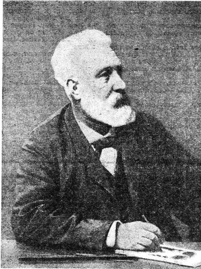
Жюль-Верн в возрасте 76 лет.

наиболее точную догадку Жюль-Верна о техническом устройстве подводной лодки. Современная лодка погружается в глубину океана, развивая огромную быстроту, покрывает большие расстояния, не показываясь на поверхности — словом, все как у нашего романиста. Точно так же, как и герои «Наутилуса», экипаж современных подводных лодок покидает свое судно, пользуясь водолазными костюмами, кислородными аппаратами, электрическим светом; и мало того, путешествие по морскому дну теперь обставлено еще большими удобствами, чем это представлял себе Жюль-Верн. И все же он резко разошелся с действительностью в одном существенном пункте. Его подводная лодка приводится в действие одним только электричеством, которое доставлялось батареями чудовищной силы. Ошибка извинительная! Как мог наш автор разгадать огромную движущую силу, скрытую в бензине. И он обошел молчанием героя современной техники — двигатель или мотор внутреннего сгорания.